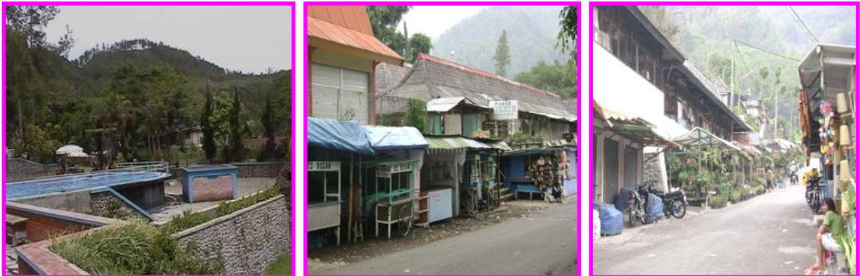
Gambar 3.1 Kawasan Songgoriti, Pasar Wisata Songgoriti, dan Kawasan Penjualan TOGA, Tanaman Hias, Souvenir, dan Binatang di Kawasan Wisata Songgoriti