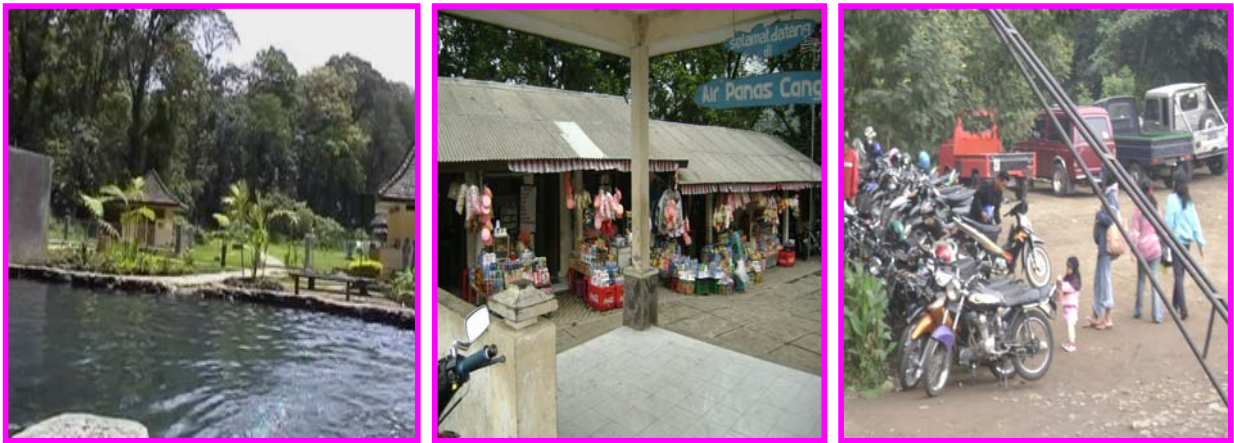
Gambar 3.2 Kawasan Cangar, Kawasan Penjualan Makanan, Minuman, Souvenir, dan Kawasan Parkir yang Luas dan Nyaman di Kawasan Wisata Canggar