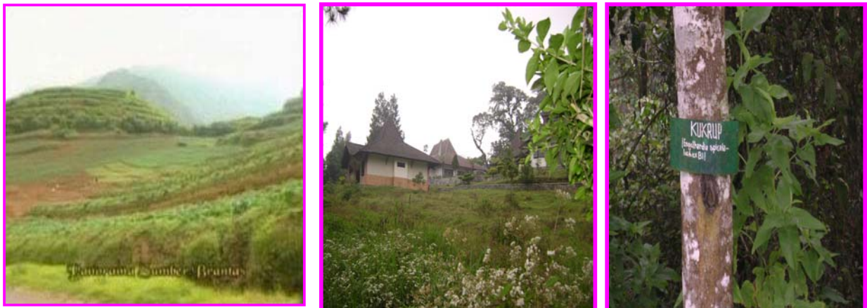
Gambar 3.4 Kawasan Bumi Perkemahan Raden Suryo Batu, Penginapan, dan Keragaman Flora di Kawasan Bumi Perkemahan Raden Suryo Batu