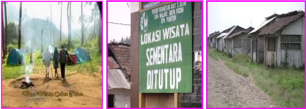
Gambar 3.3 Kawasan Coban Talun, Coban Talun Ditutup Sementara Berdasarkan Surat General Manager Perum Perhutani Unit II Jawa Timur nomor: 285/043.7/Wisata/ KBM.WBU/II, dan Kondisi Warung di Kawasan Coban Talun Setelah Ditutup